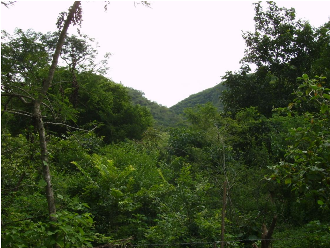
Panorámica que muestra al fondo el prospecto Agua Dulce, donde se tiene dos lomas con depósito de yeso para su explotación inmediata.